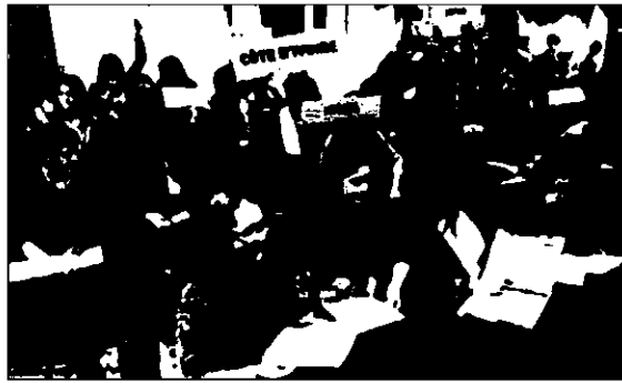
Los alumnos participantes en la Global Classrooms Cantabria indicando los países a los que representaban.